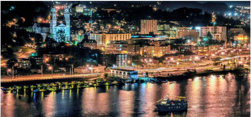
Centre-ville de Saguenay

La bande vidéo de ma lecture de ce texte est accessible dans le site Web du Réseau Québec-France